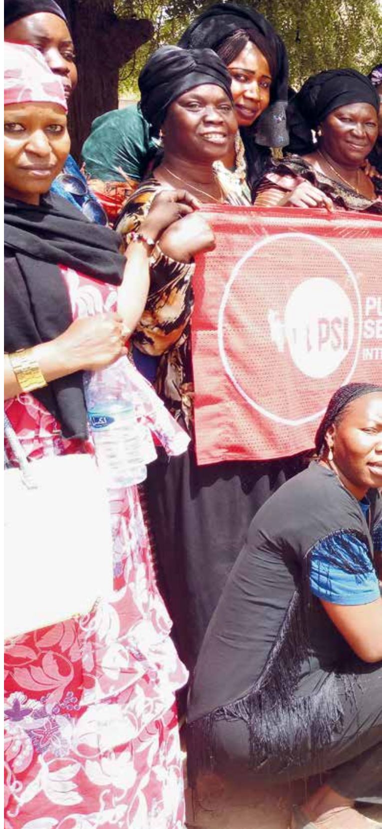
▲ Ökad facklig organisering och jämställdhet är ett par av huvudmålen för ST:s och PSI:s projektarbete i Västafrika.

– När folk lyckas få ett jobb vill de inte riskera att förlora det. Många är rädda för att straffas om de går med i facket. En hel del kvinnor är också avvaktande på grund av fördomar om vad kvinnor förväntas göra eller genom att deras män motsätter sig att de arbetar fackligt. Det här innebär enorma svårigheter när det gäller att