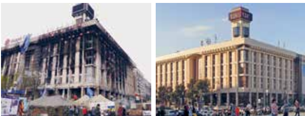
▲ 2014 eldhärjades förbundshuset vid Maidanorget i centrala i Kiev. Delvis tack vare ett stöd på mer än 100 000 kronor från ST:s solidaritetsfond kunde huset renoveras och det återinvigdes 2019.