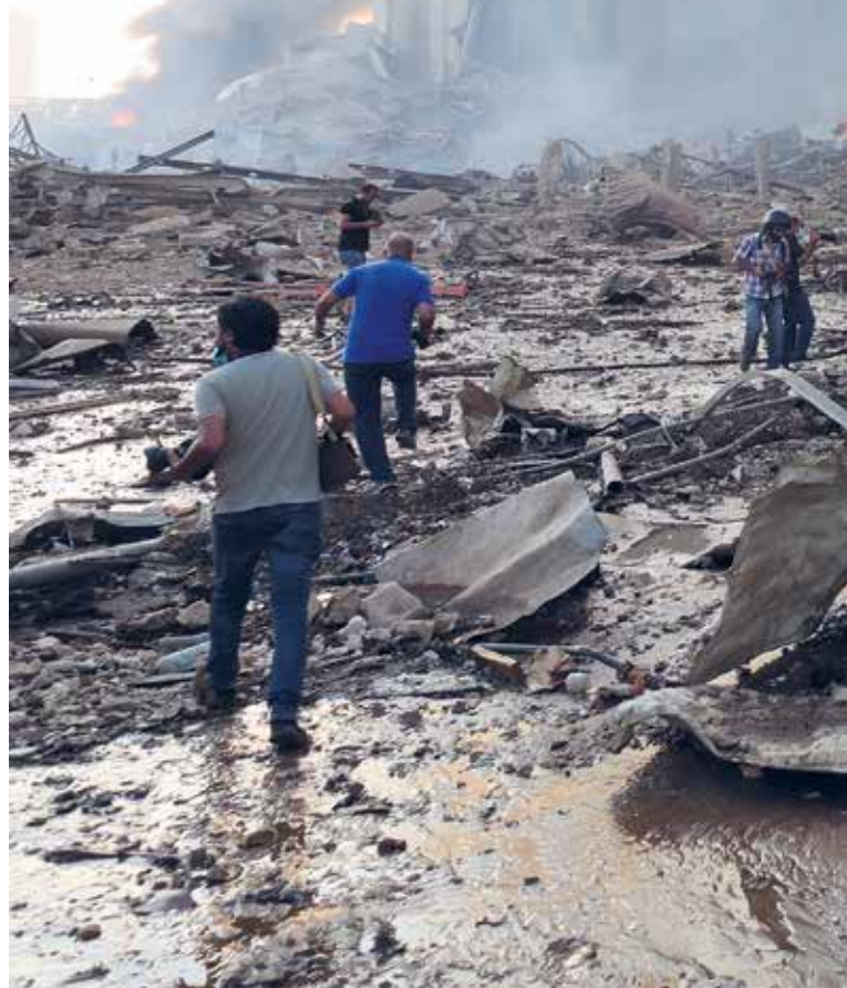
▲ Beirut efter explosionen den 4 augusti 2020.

Du kan bidra genom att swisha valfritt belopp till 123 516 4876 eller sätta in på bg 365-6071.